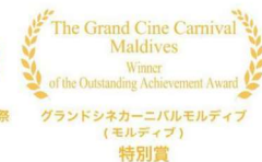
グランドシネカーニバルモルディブ（モルディブ） 特別賞