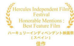
ハーキュリーインディペンデント映画祭（スペイン） 佳作