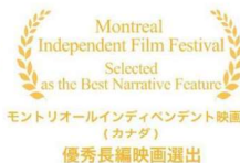
モントリオールインディペンデント映画祭（カナダ） 優秀長編映画選出