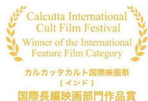
カルカット国際映画祭（インド） 国際長編映画部門作品賞