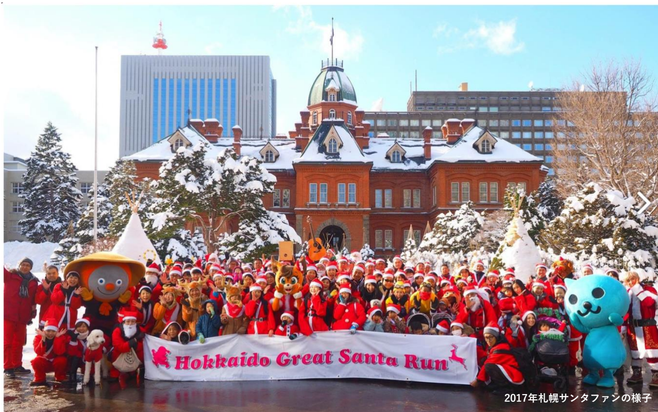
2017年札幌サンタファンの様子